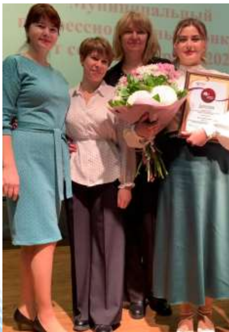
Муниципальный профессиональный конкурс «Педагогический дебют»