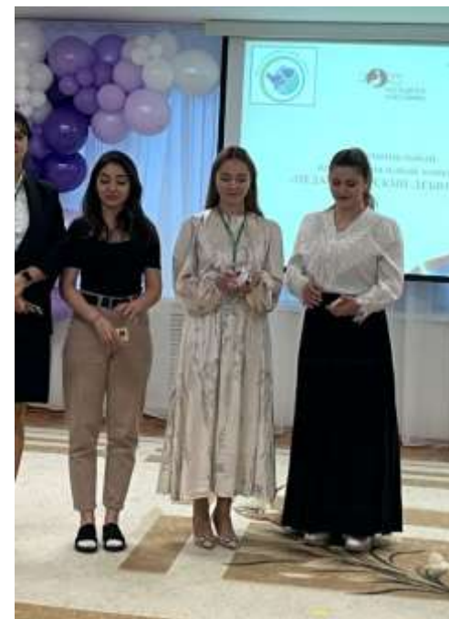
Муниципальный профессиональный конкурс «Педагогический дебют»