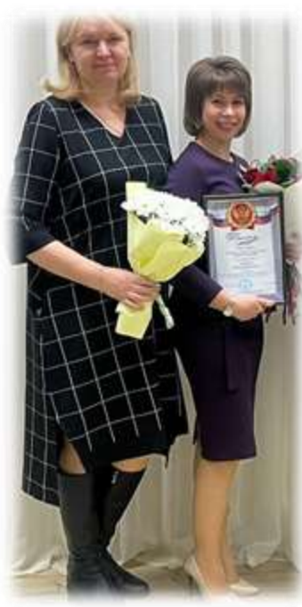
Муниципальный профессиональный конкурс «Педагог наставник»